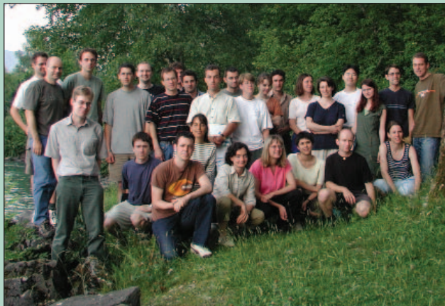
NCCR Climate’s young scientists just minutes before taking a cool swim in lake Thun